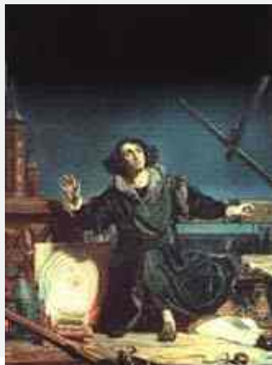
Coperta: Pictura reprezentandu-l pe Nicolae Copernic, devenit simbol al orasului. Replica aflata la Muzeul dedicat lui Copernic din Frombork (originalul se afla in Varsovia).