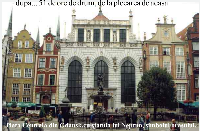
Piata Centrala din Gdansk cu statuia lui Neptun, simbolul orasului.