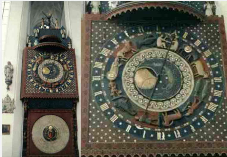
Gdansk: Calendarul astronomic din interiorul Catedralei Sf. Maria