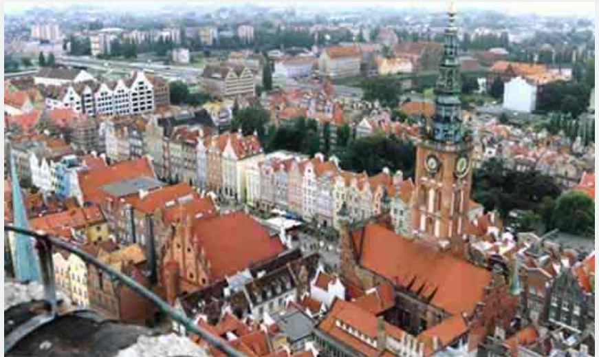
Gdansk: Vedere din turnul Catedralei Sf. Maria. In prim-plan, turnul Primariei vechi

Frombork: Apus de Soare. Vedere la vest (plaja Golfului Gdansk-Marea Baltica), respectiv la est (orasul Frombork vazut din port)