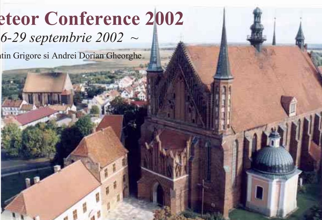
Golful Gdansk, Frombork si Catedrala lui Copernic. Vedere din turnul Pendulului Foucault

De notat faptul ca toate participarile romanesti au fost facute cu contributii la programul conferintelor, prin prezentarea de lucrari (comunicari si postere). Aici trebuie evidentiata cateva reusite prin care Romania a iesit in evidenta la aceste evenimente: