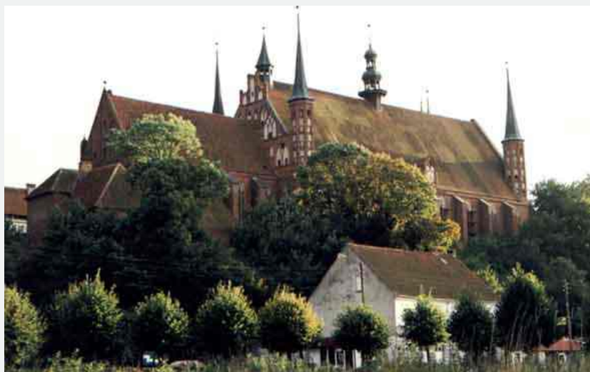
Catedrala lui Copernic din Frombork, vedere de la fereastra camerei de hotel